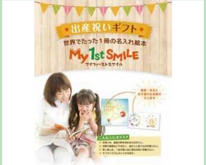
■ お子さまの名前が主人公になる絵本「My 1st SMILE」