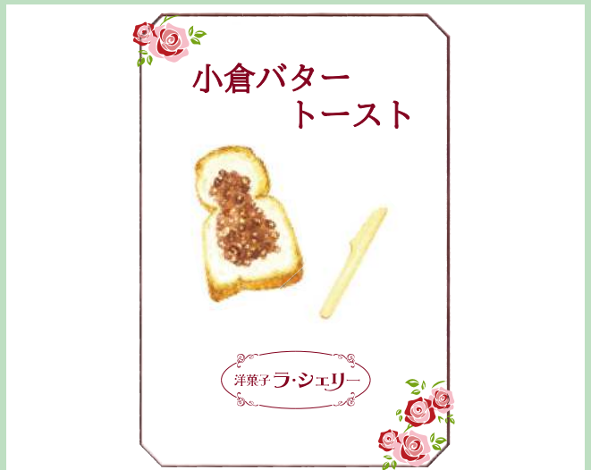
■ 大切な人を想い、贈るギフト