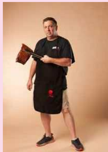
■ BBQ ソース登場！ BBQ マスター・トロイのアメリカの味を国産で遂に再現