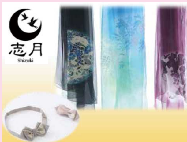
■ 他の人と同じ物を好まなく良質な一点物を持つことに価値を感じる方々へ