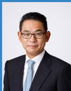
大塚 浩史 氏 (オオツカ ヒロシ) 武蔵精密工業株式会社 代表取締役社 長・最高経営責任者 14 カ国・35 拠点を有する自動車部品 メーカーを率いる。国内外のスタート アップへの出資、連携を積極的に行っ ており、2019 年にはイスラエルの AI スタートアップとのジョイントベン チャー「Musashi AI」を設立。社会課 題の解決を目指し、業種の枠を越えた 新たな事業創造に取り組んでいる。