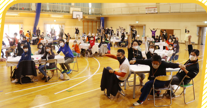
グループ対抗の経済カードゲーム

●今回のワークショップの内容は、様々な年齢の方達向けに行い好評だったものを2時間で学ぶ充実の内容です!