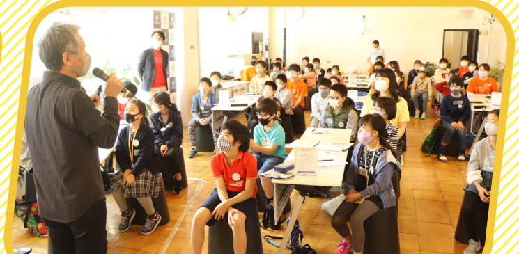
専門家から学ぶ未来の描き方