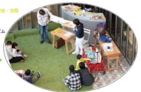
文化体験機会のイメージ